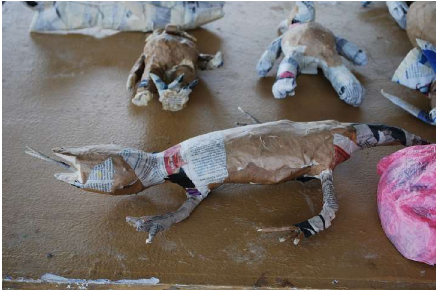
AlejandroLinaresGarcia / CC BY-SA 4.0