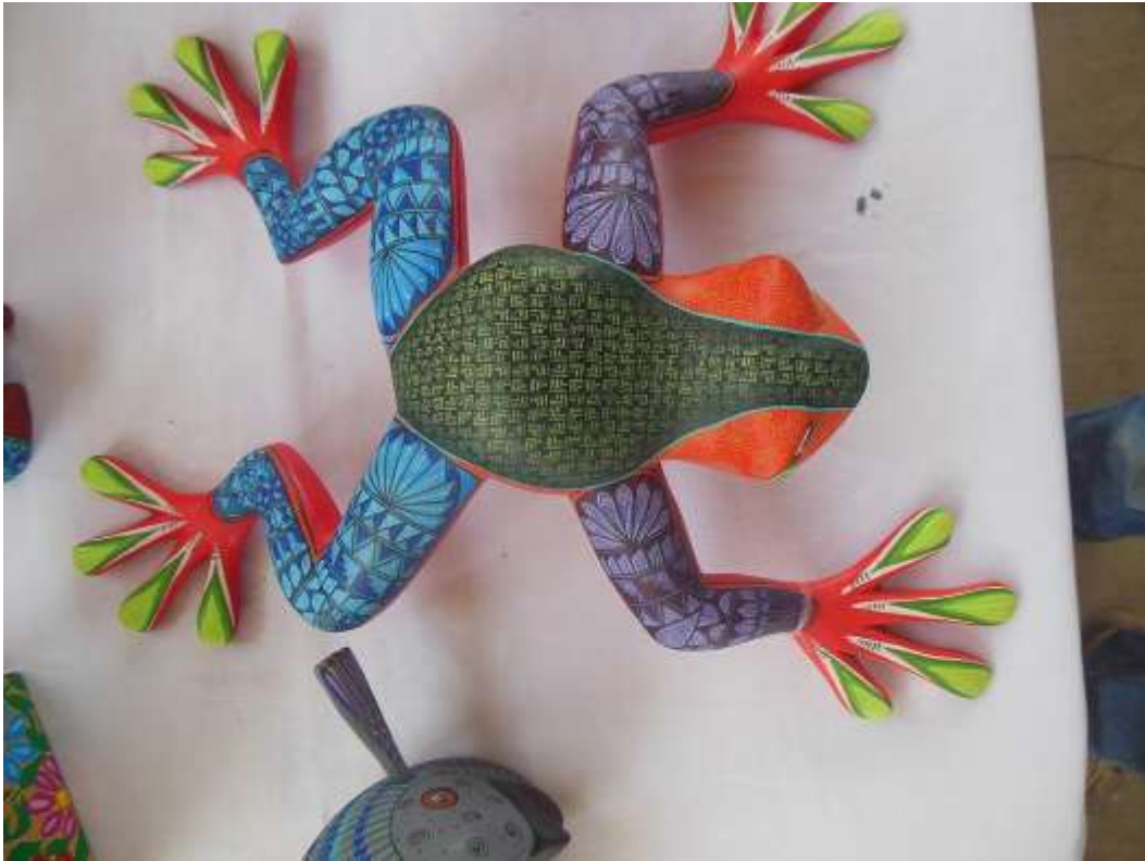
Huitzilpochtli / CC BY-SA ( https://creativecommons.org/licenses/by-sa/4.0 )