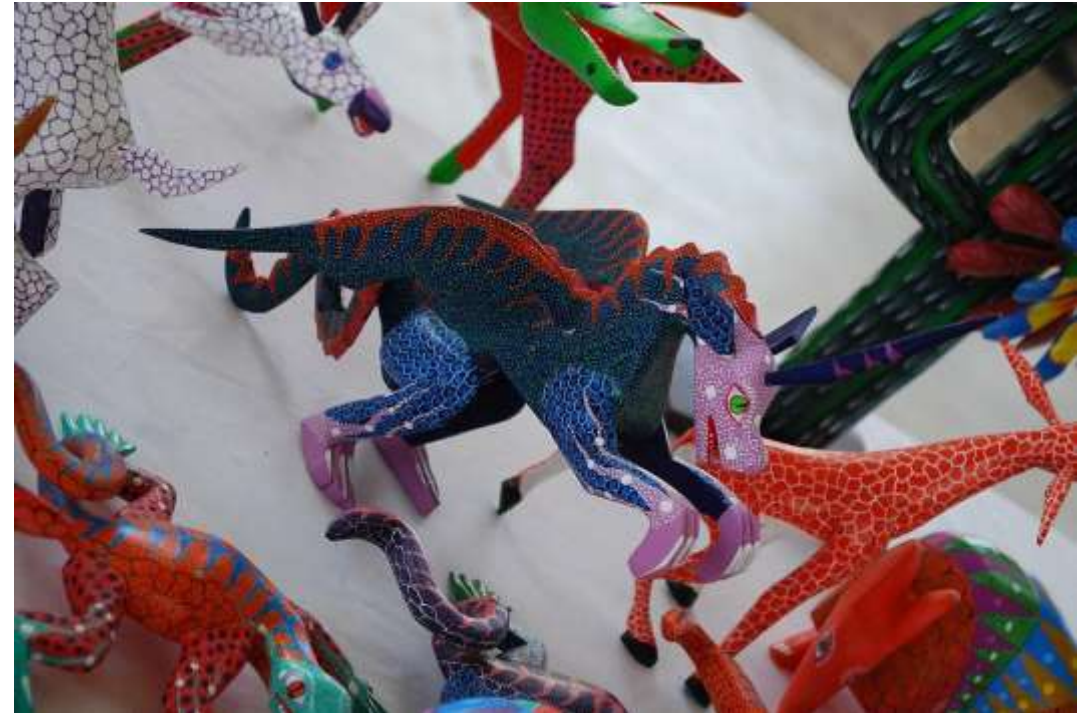
AlejandroLinaresGarcia / CC BY-SA ( https://creativecommons.org/licenses/by-sa/4.0 )

Usa el libro de actividades y las instrucciones para hacer tu propio alebrije.