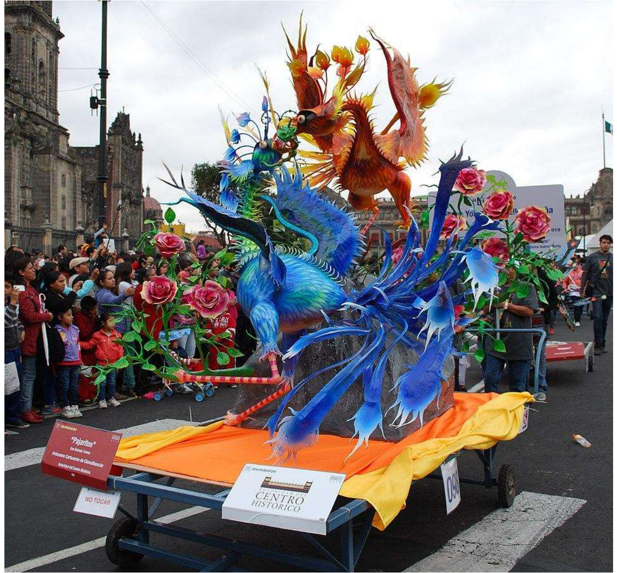
Thelmadatter / CC BY-SA ( https://creativecommons.org/licenses/by-sa/4.0 )