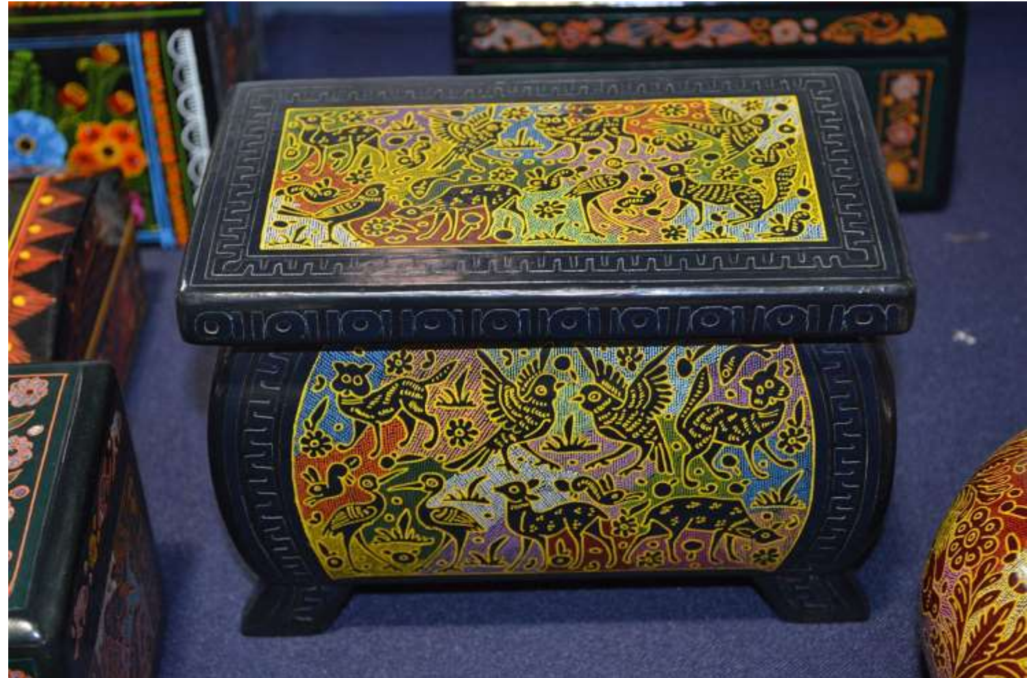
AlejandroLinaresGarcia / CC BY-SA ( https://creativecommons.org/licenses/by-sa/4.0 )

Pueden imaginarse cuánto tiempo se toma alguien en terminar un objeto.