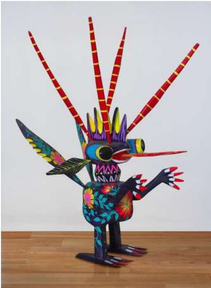
Carlos Valenzuela / CC BY-SA ( https://creativecommons.org/licenses/by-sa/4.0 )