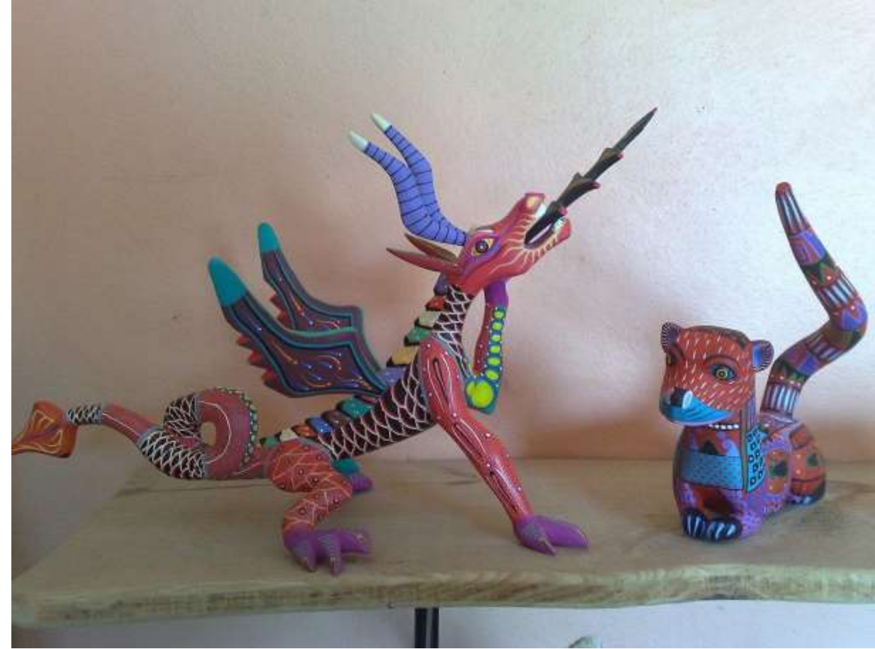
Álvaro de la Paz Franco / CC BY-SA ( https://creativecommons.org/licenses/by-sa/4.0 )